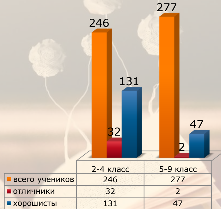
Рисунок 2. Мониторинг успеваемости