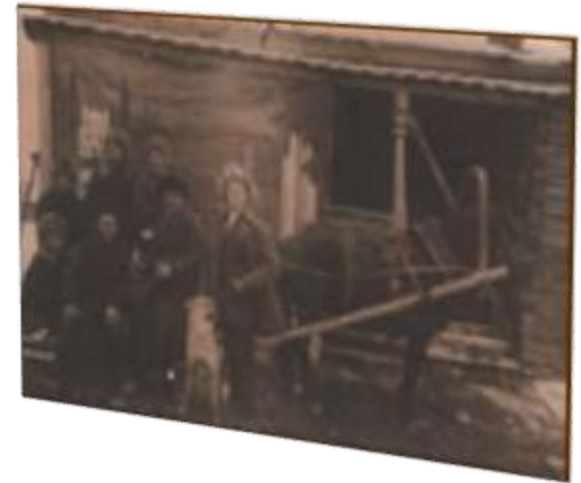
Ямщики перед выездом.