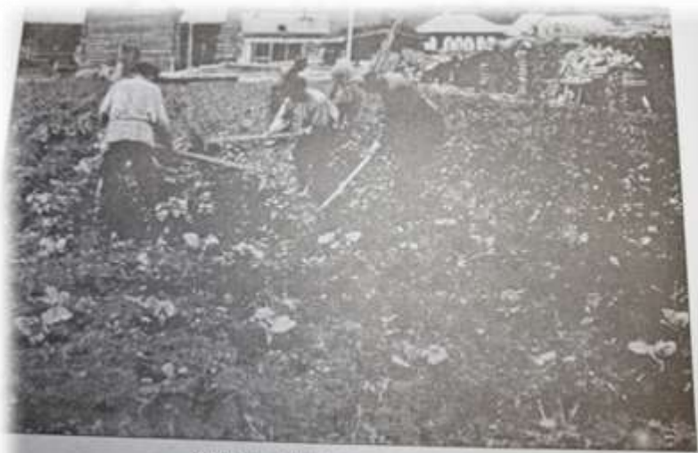
Прополка капусты у мельницы.