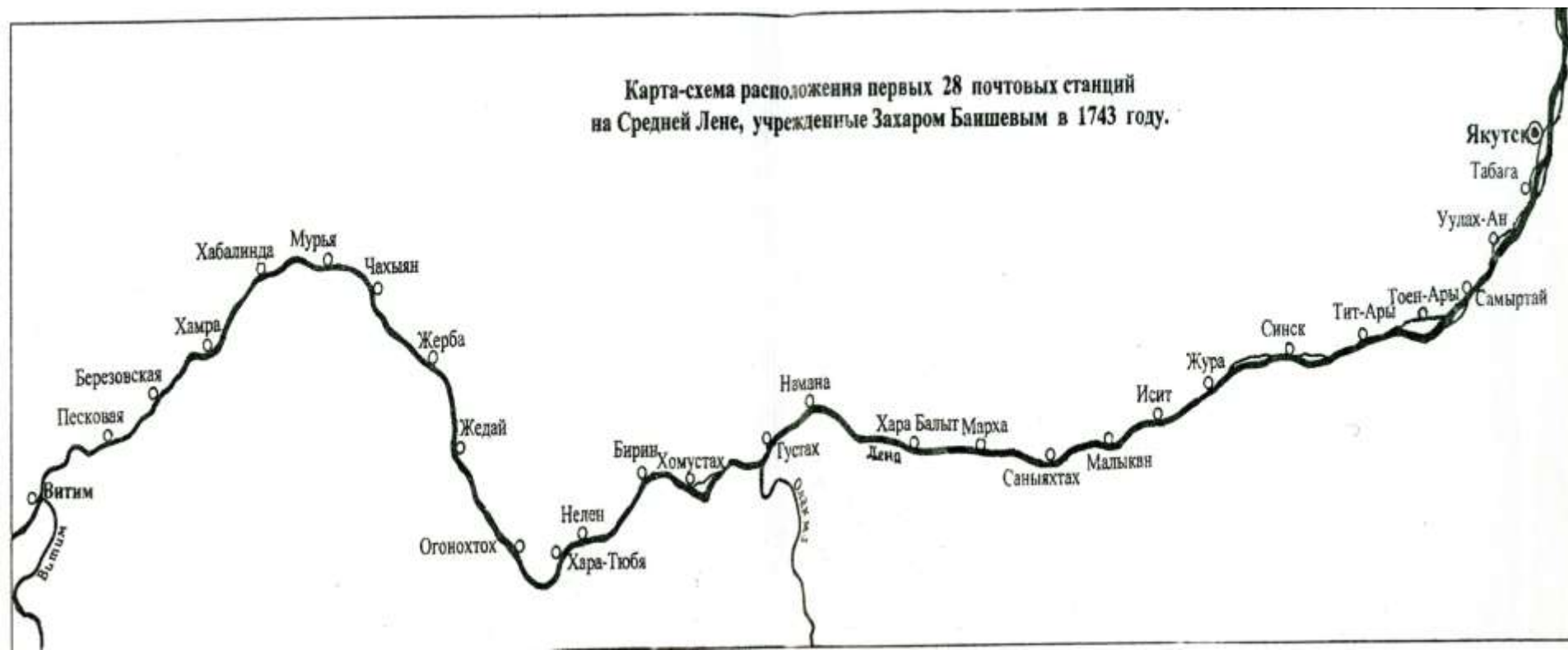
Карта-схема расположения первых 28 почтовых станций на Средней Лене, учрежденные Захаром Баншевым в 1743 году.