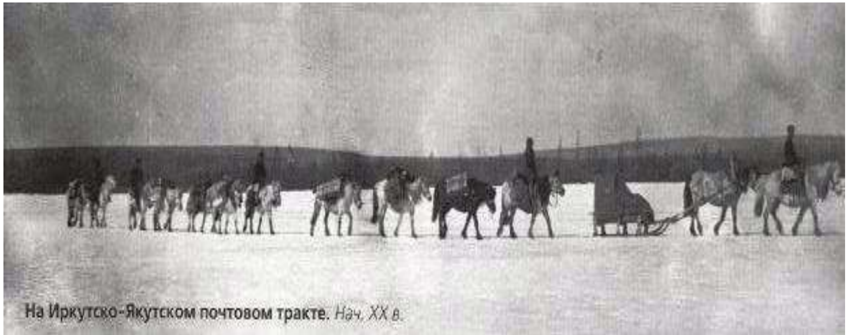
На Иркутско-Якутском почтовом тракте. Нач. XX в.