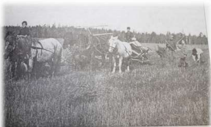
Уборка хлеба с техникой.