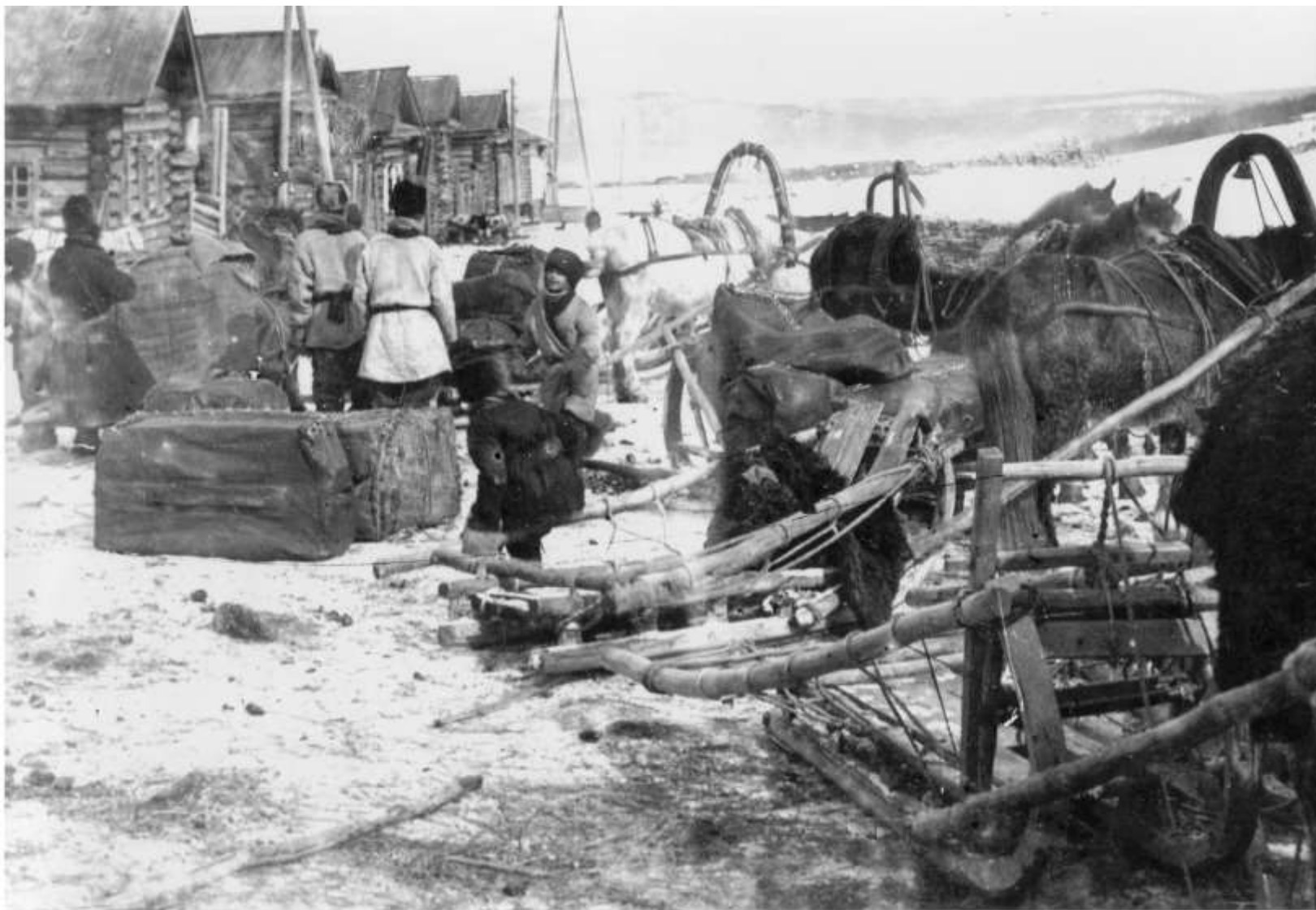
Почтовый обоз перед отправкой из Олекминска Вторая половина XIX века