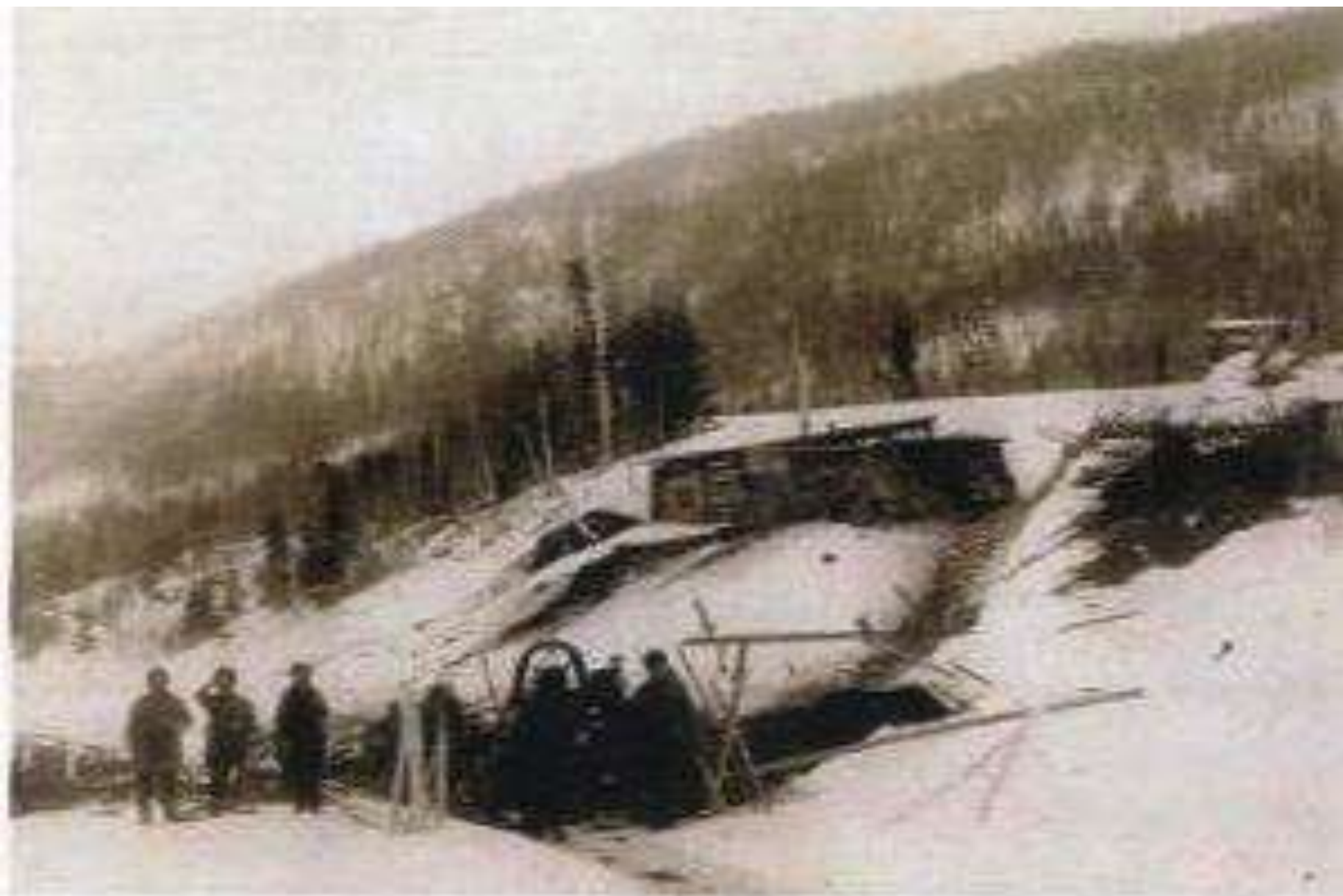
Станция Ат-Дабан на Иркутско-Якутском тракте, 1902 г.