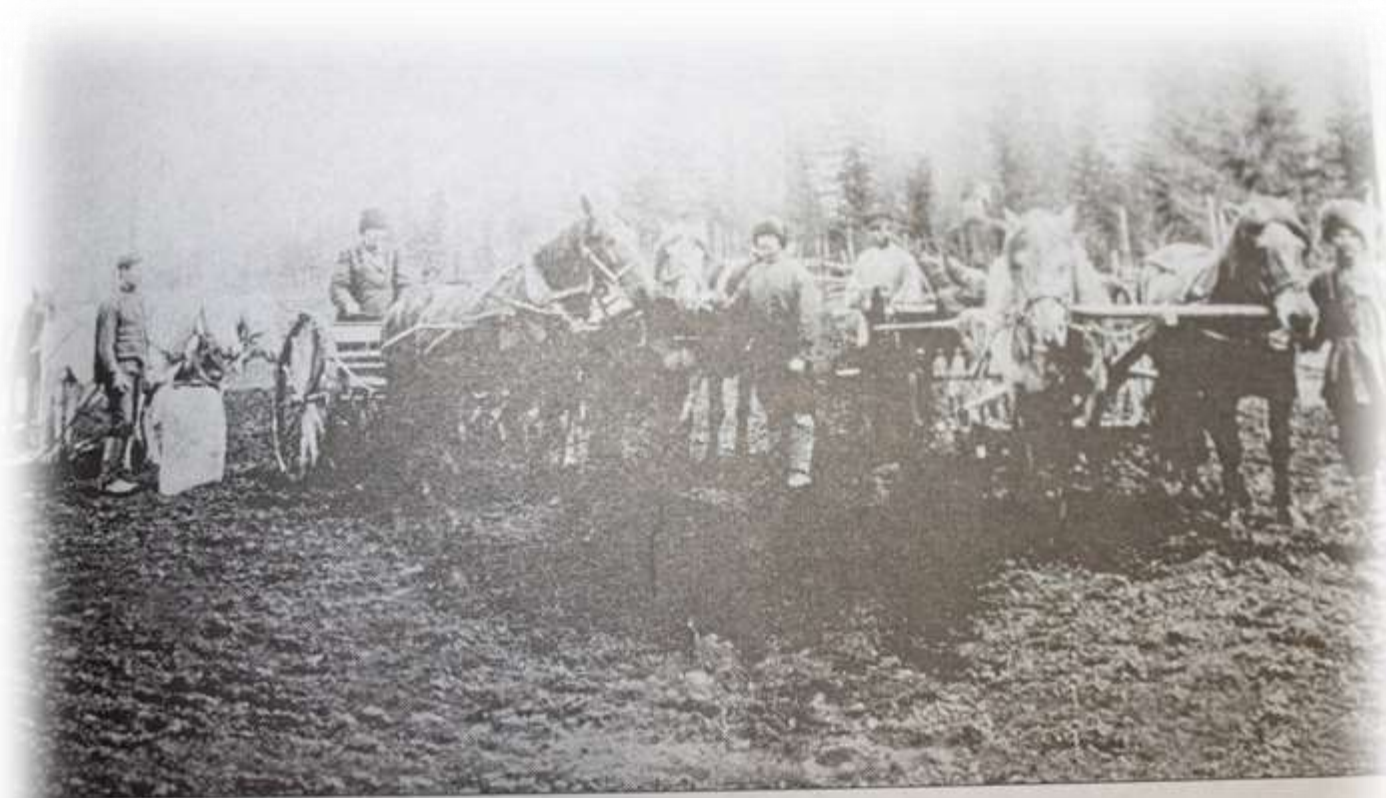
Посевные работы в окрестностях Олёкминска.