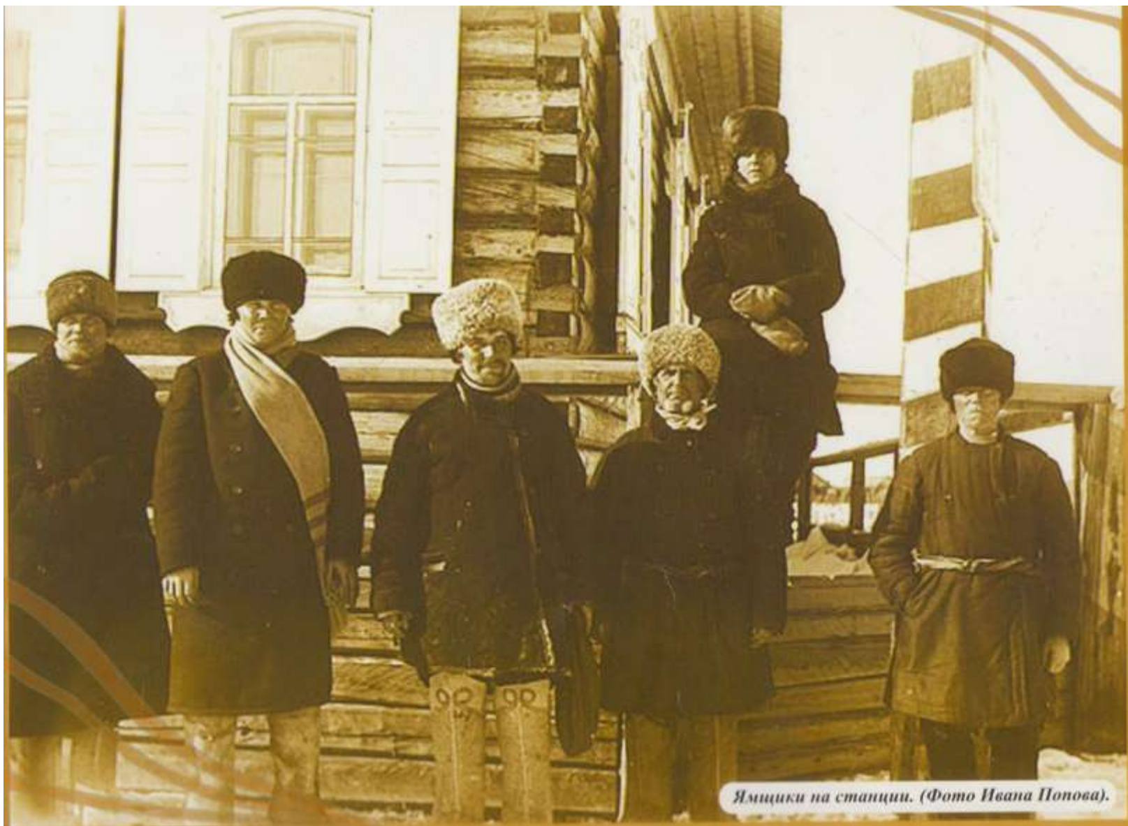
Ямцики на станции. (Фото Ивана Попова).