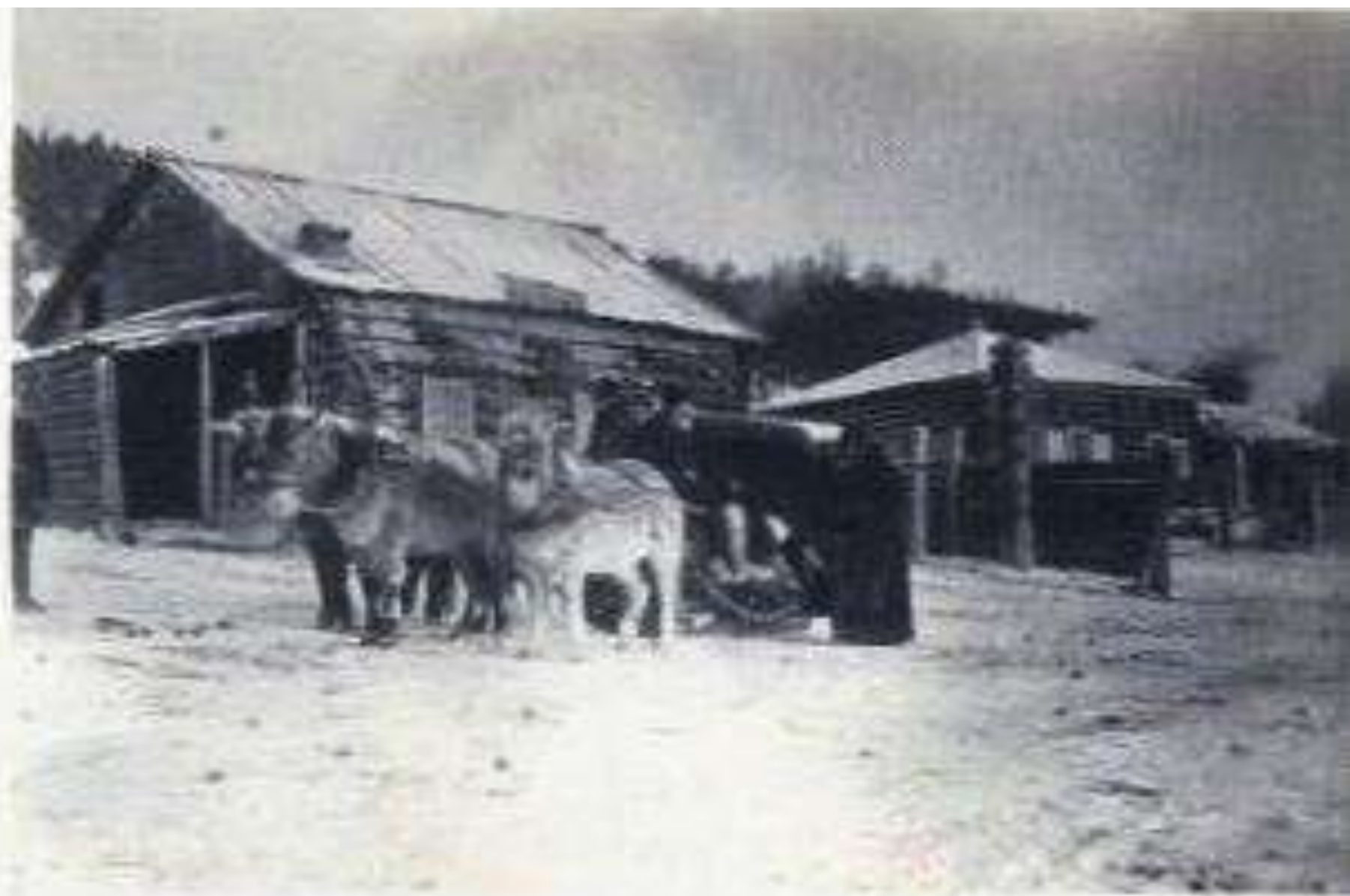
Почтовый возок перед станцией Лена. Нач. XX в.