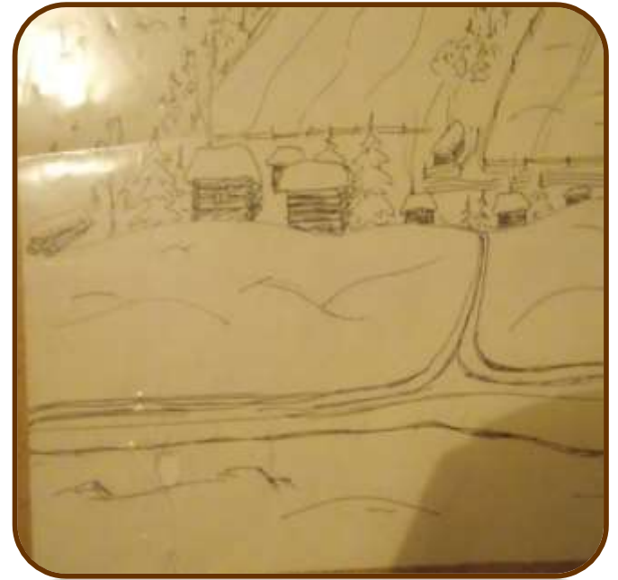
Почтовый станок (станция)